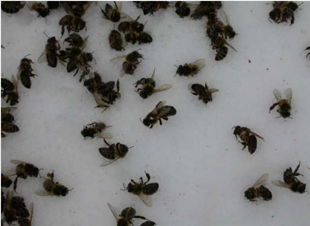
Der Verlust von Versuchsvölkern ist immer sehr schmerzhaft.

den Inselversuchen von Gotland wurde die Völkerstärke nicht geschätzt. Dennoch sind den Forschern die deutlichen Schwankungen in der Grösse der Bienenpopulation aufgefallen, die Kleinvolkphase scheint auch da eine Rolle gespielt zu haben. Die Kleinvolkphase zeigt jedoch auch auf, wie weit diese einzeln stehenden Versuchsvölker von einer imkerlichen Nutzung entfernt sind. Die Phase tritt im Mai, Juni und Juli auf. In der wichtigsten Trachtzeit sind schrumpfende Völker wenig attraktiv. Kleinvölker, welche nur knapp überleben, bilden zudem ein Risiko auf einem Bienenstand mit andern Völkern im Bezug auf Räuberei und Verbreitung von Varroa und Krankheiten.