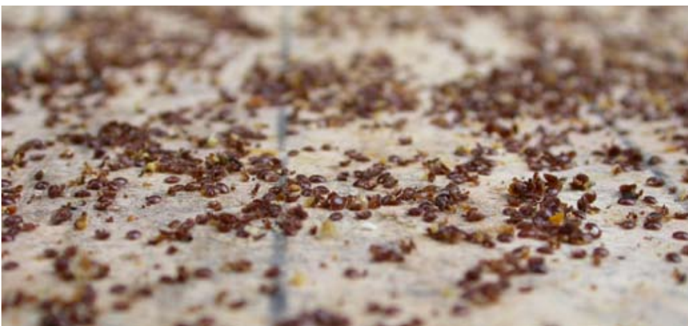
14. September 2006, das Kontrollvolk nach der Ameisensäurebehandlung mit 2 830 Milben.